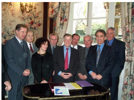
C'est signé! Les maires ne cachent pas leur satisfaction: l'outil est à la mesure de leurs espérances.