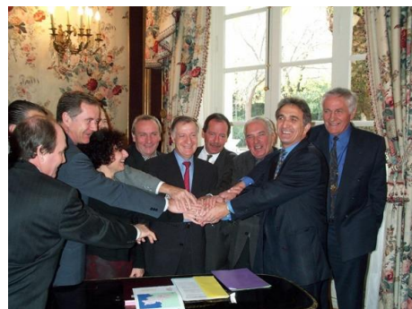
L'union fait la force! la C.A.P.A. en est une illustration bien réelle!

La C.A.P.A. est une force économique pour les Communes qui permettra la réalisation de projets importants et très coûteux qu'aucune Commune individuellement n'aurait pu supporter financièrement, notamment :