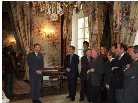
Discours et présentation par le préfet de Région, Dominique DUBOIS, devant une assistance attentive.

La création de la C.A.P.A. a donné lieu à une importante cérémonie présidée par le Préfet de Région Dominique DUBOIS. Elle vous est présentée en quelques images qui en illustrent les temps forts.